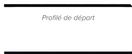
Profilé de départ